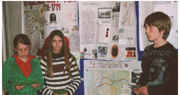
Elever från klass 8A Verdalsøra Ungdomsskole utarbetade en utställning som de presenterade på Stiklestad den 12. maj.

Skolåret 2003-2004 var det klass 8A från Verdalsøra Ungdomsskole og klass 7G från Parkskolan Österund som arbetade med Mittnordisk historia och besökte varandra. Skolklassutbyte ska genomföras även under skolår 2004-2005.