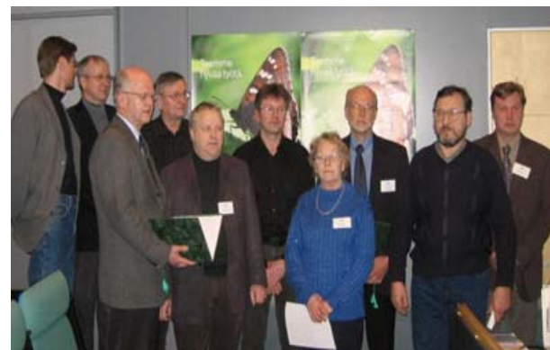
Grundningsdokumentet har undertecknats.