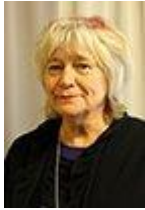
Ordförande Margareta Winberg (s) Tel +46 70-510 07 47 margareta.winberg@regionjh.se